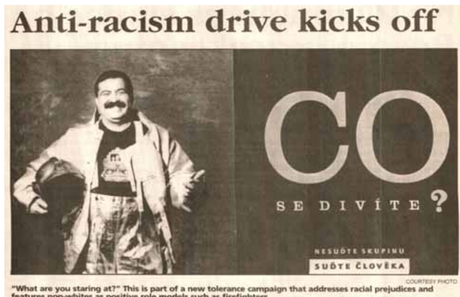
Kampaň s názvem CO SE DIVÍTE se objevila i na stránkách zahraničního tisku

Pouhý rok poté mě oslovil manžel kolegyně, Američan, který působil v pražské pobočce mezinárodní reklamní agentury. Prostředí se lišilo, na rozdíl od Juula působil v luxusní kanceláři a jméno agentury bylo kupodivu známé i mně, která jsem se ve světě reklamy ani trochu neorientovala. I tohoto „dobře situovaného“ pražského cizince, který se bezpochyby pohyboval ve zcela